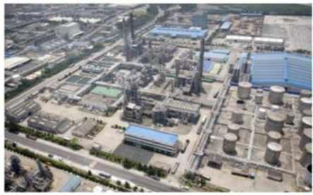
전기, 전자, 산업일반 IEC 61508

◆ 안전 중요 SW 개발 시, 안전 관련 국제 표준에 근거하여 체계적으로 개발