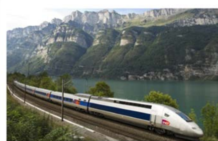
철도 EN 50129, 50126