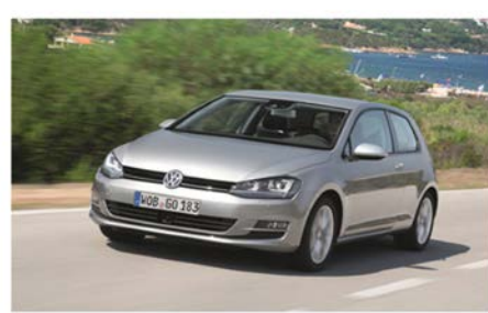
자동차 ISO 26262