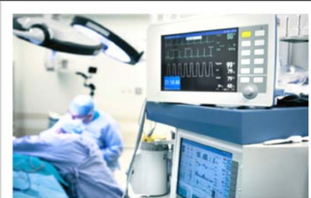
의료 IEC 62304, 60601