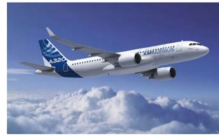
항공 ARP 4754, DO-178