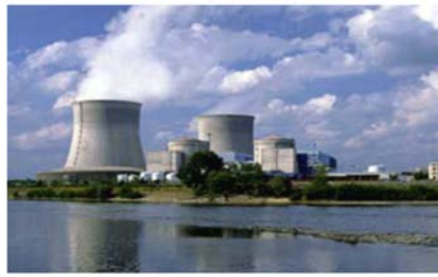
원자력 IEC 60880, 61513